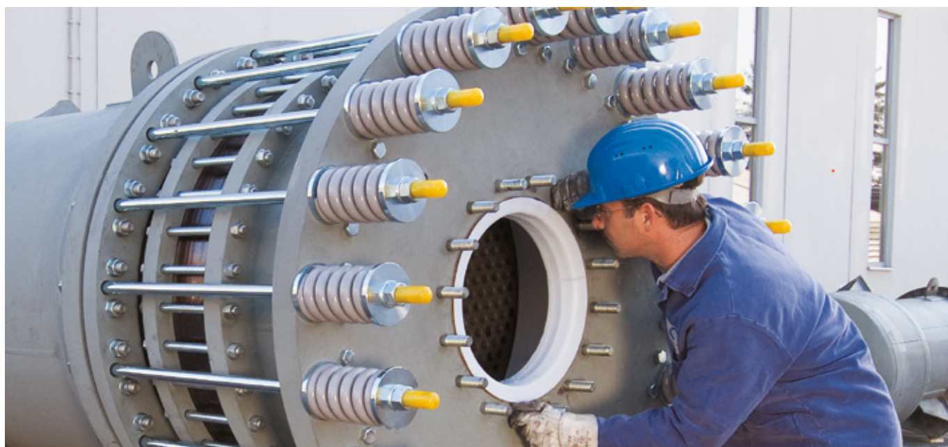
↑ 当社による設置状況の検査

当社の専門技術とカスタマーサポートは、製品の納入と設置で終わりではなく、それが始まりとなります。当社の専門家と共に定期的な検査を行うことで、想定外の機能停止のリスクが大幅に低減します。隠れている問題を把握し、それが発現する前に解決することができます。その結果、運用コストを削減し、お客様の大切な資産の耐用年数を最大限に延ばし、性能を最大限に引き出すことができます。