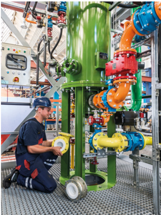
↑ 塩酸合成ユニットの取り付け